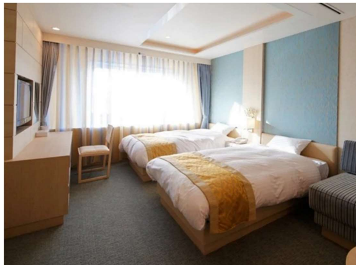
船内セミスイート（イメージ）