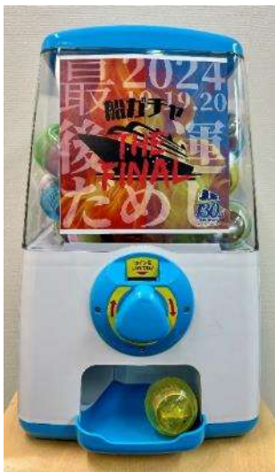
船ガチャ（イメージ）